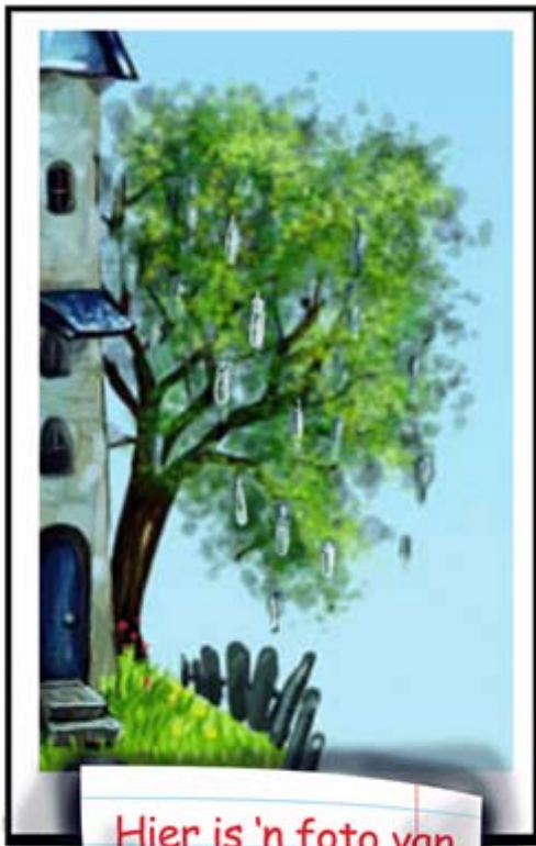
Hier is 'n foto van die melkboom.

"Maak gou! " skreeu ek en spring nog meer op en af.